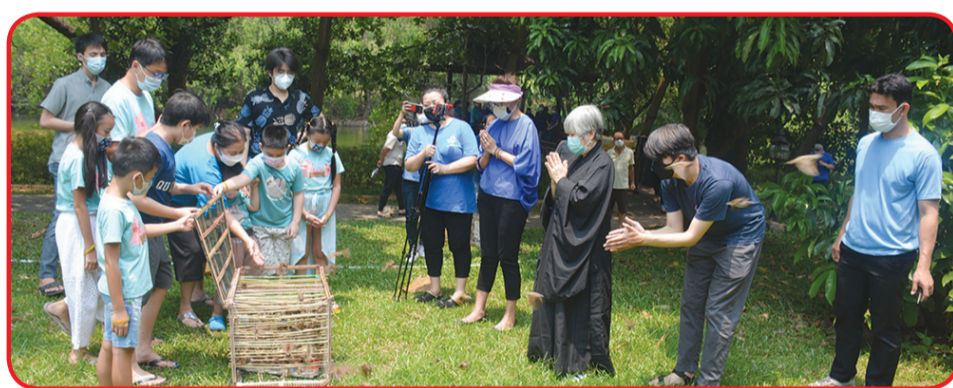
Prosesi pelepasan burung ke kawasan hutan mangrove.