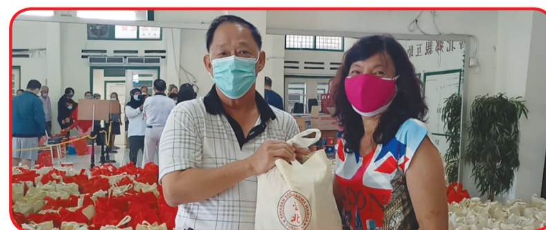
Aneng memberikan paket sembako ke warga.

Pada kesempatan itu, Aneng menanyakan kepada anggota apakah sudah divaksin Covid-19, apabila belum agar segera meng-