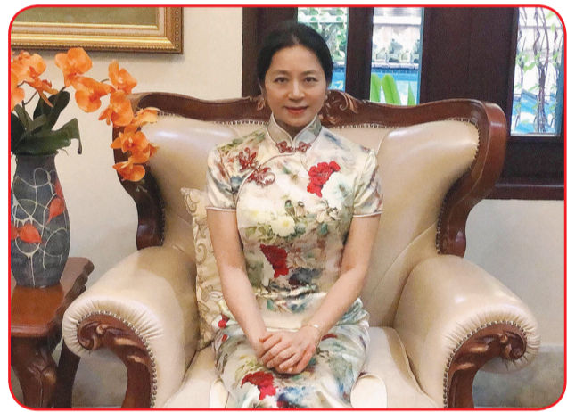
Konjen T Qiu Weiwei.

menyatakan doa dan salam dari Konsulat Jenderal Tiongkok di Medan membuat semua orang merasakan kebahagiaan di momen pandemic Covid-19 ini. Dan akan terus mengembangkan tradisi kebaikan etnis Tionghok sekaligus mengembangkan keunggulan diri sendiri demi memberikan kontribusi bagi interaksi dan persahabatan serta kerjasama pragmatis Tionghok-Indonesia. • idn/din