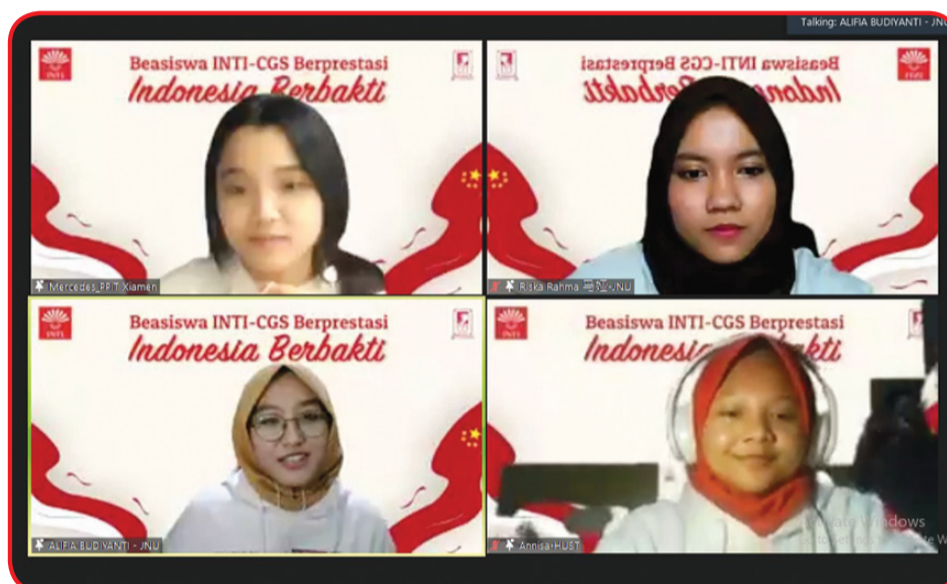
Narasumber dan moderator talkshow daring.