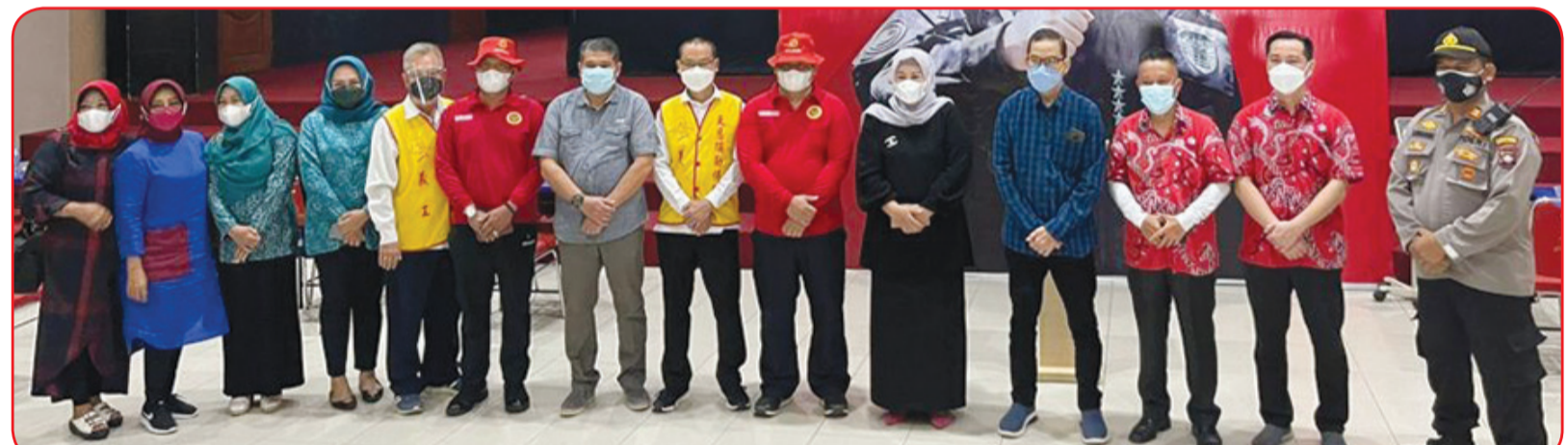
Sejumlah tokoh termasuk pengurus PSMTI Kepri berfoto bersama dalam vaksinasi yang berlangsung di di Vihara Maitreya, Batam Centre.

Binda Kepri Kolonel CHB Komara Manurung menyatakan kepada masyarakat kali ini pihaknya menyiapkan 5100 dosis vaksin untuk remaja. "Ya hari ini ada 5.100 dosis vaksin sinovac yang diperuntukan untuk remaja," kata Komara Manurung. Komara Manurung me-