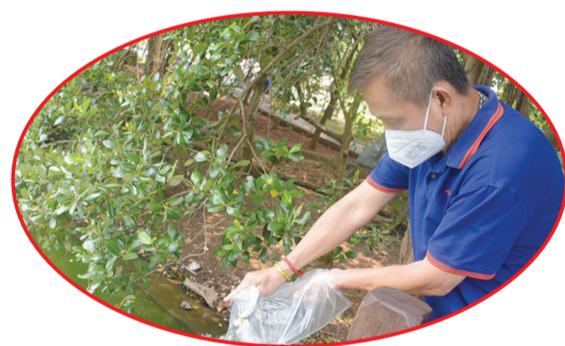
Prosesi pelepasan hewan ke perairan hutan mangrove.