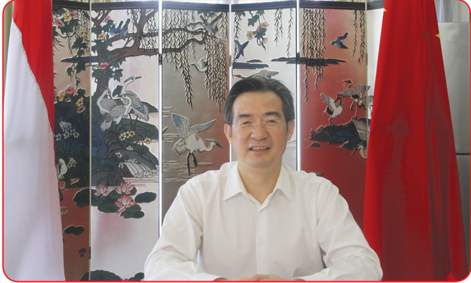
Konjen Zhu Xinglong.

DENPASAR (IM) - Konsulat Jenderal Tiongkok di Denpasar Jumat (17/9) lalu mengadakan perayaan Mid Autumn Festival secara online. Perwakilan dari 10 komunitas Tionghoa, termasuk LIT (Lembaga Indonesia-Tionghoa), PSMTI (Paguyuban Sosial Marga Tionghoa Indonesia), Perhimpunan