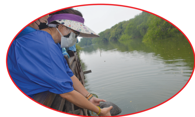
Prosesi pelepasan hewan ke perairan hutan mangrove.

YEMI (Yayasan Etika Moral Indonesia) dan Diklat Prajna Nyakrawati mengadakan bakti sosial dengan membagikan 600 paket sembako, di aula gedung yayasan tersebut, Jalan Sulung No 31 Surabaya.