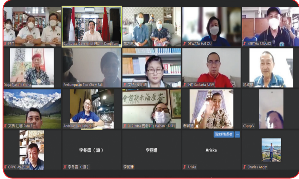
Para tokoh yang ikut serta dalam perayaan Mid Autumn Festival.

antara kedua negara. "Diharapkan semua pihak akan terus menaruh perhatian dan mendukung perkembangan dan pembangunan Tionghok. Serta aktif menjembatani kerjasama kedua negara di berbagai bidang," ujarnya. Konjen Zhu Xinglong menekankan sejak merebaknya pandemi Covid-19, dibawah